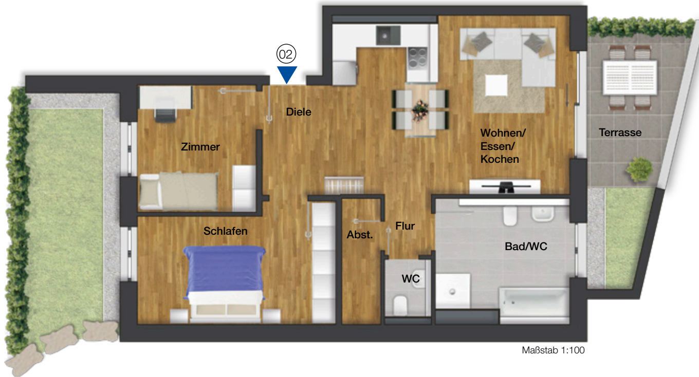
Lage der Wohnung